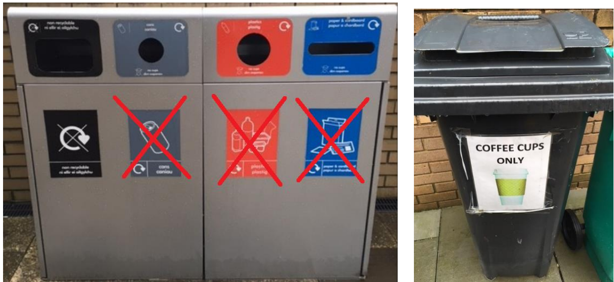
Ffigwr 2: - Biniau pedair adran a biniau contractwyr ar safleoedd Prifysgol Abertawe

I helpu i leihau nifer y cwpanau coffi tafladwy sy'n cael eu defnyddio yn y Brifysgol, defnyddiwch Gwpan Cadw a derbyn gostyngiad 25c ar bob cwpanaid o goffi a brynwch