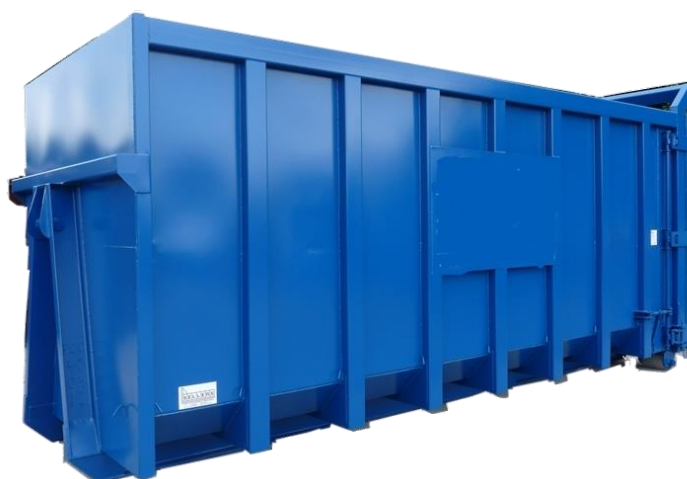
Ffigwr 1 - Sgip 35 llathen Prifysgol Abertawe ar gyfer metel

Mae sgip metel allanol ar Gampws Parc Singleton lle gellir rhoi pob math o wastraff metel. Fodd bynnag, ni ddylid rhoi unrhyw fetel wedi'i halogi yn y sgip. Darllenwch nodyn WMGN31 - Naddion am arweiniad ar gael gwared ar fetel halogedig.