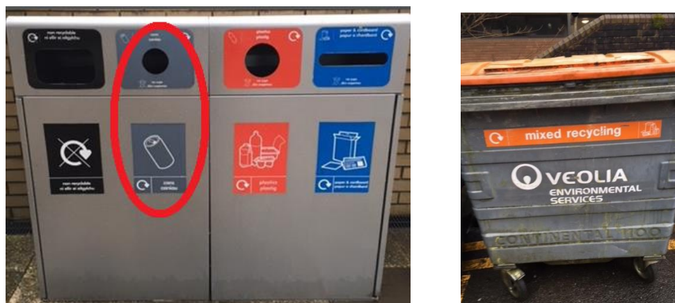
Ffigur 2 – rhesi o bedwar bin allanol a bin contractwr allanol Prifysgol Abertawe

Dylid defnyddio dim ond rhesi o bedwar/ddau fin metel sydd â chaeadau wrth eu blaenau i waredu caniau i'w hailgylchu. Ni ddylid defnyddio biniau eraill ar gyfer eitemau rhydd.