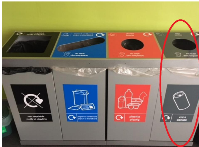
Ffigur 1 – rhes o bedwar bin dan do Prifysgol Abertawe

Dylid defnyddio dim ond rhesi o bedwar/ddau fin metel sydd â chaead a bagiau clir i waredu caniau sydd i'w hailgylchu. Ni ddylid defnyddio cynwysyddion personol/o dan eich desg mewn swyddfeydd gan fod hyn yn atal ailgylchu deunyddiau.