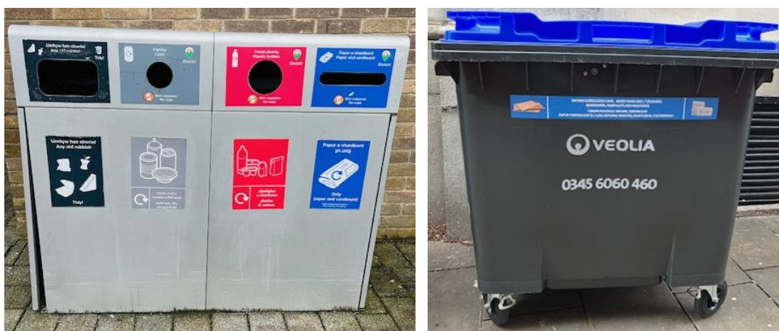
Ffigur 2 – rhesi o bedwar bin allanol a bin contractwr allanol Prifysgol Abertawe

Dylid defnyddio rhesi o bedwar/ddau fin metel sydd â chaead wrth eu blaenau'n unig i waredu papur/cerdyn. Rhoddir label "Papur Cymysg" ar yr holl gynwysyddion. Ni ddylid defnyddio biniau eraill ar gyfer eitemau rhydd.