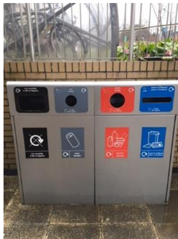
Ffigur 2 – Bin 'cwad' allanol Prifysgol Abertawe

Mae biniau 'cwad' wedi cael eu gosod ar draws campysau'r Brifysgol yn yr holl fannau cymunol, yn y manau mwyaf prysur ac wrth fynedfeydd, er mwyn gallu gwahanu gwastraff ac ailgylchu. Yn yr awyr agored, defnyddir cwads/parau metel sy'n agor o'r top gyda bagiau du ar gyfer pethau nad oes modd eu hailgylchu a bagiau clir ar gyfer ffrydiau ailgylchu (papur, plastig a chaniau) ddim ond i'r fanyleb a gofnodir yn Ffigur 2. Mae Ffigur 3 yn tynnu sylw at gynwysyddion gwastraff allanol eraill a ddefnyddir gan y Brifysgol ar gyfer ffrydiau ailgylchu eraill.