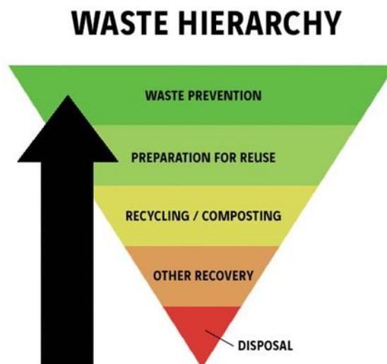
Ffigur 1: Triongl Hierarchaeth Wastraff

Rhaid ystyried hierarchaeth wastraff wrth benderfynu beth yw'r opsiwn gorau i reoli ffrwd wastraff. Mae hwn yn ofyniad gorfodol o dan Rheoliadau Gwastraff (Cymru a Lloegr) 2011. Mae'n rhoi mwy o bwyslais ar atal gwastraff, ac yn ei gwneud yn ofynnol i sefydliadau ystyried paratoi gwastraff i'w aildefnyddio, yna cyfleoedd i ailgylchu, cyn opsiynau fel adfer ynni. Yn ôl y gyfraith, mae angen i ni ddefnyddio'r hierarchaeth wastraff er mwyn sicrhau ein bod yn lleihau effeithiau ein gweithgareddau gwastraff i'r eithaf.