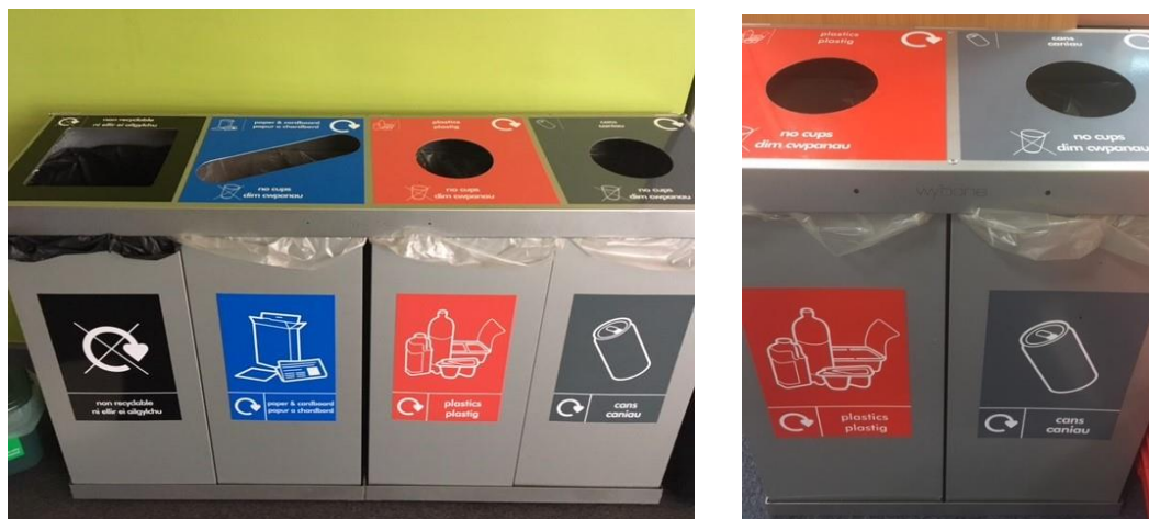
Ffigur 4 – Biniau 'cwad' a 'phâr' Prifysgol Abertawe

Bydd gan fannau dysgu, megis neuaddau darlithio sy'n cynnal mwy na 100 o seddi, fin cwad wedi'i lleoli o fewn y gofod. Bydd gan fannau dysgu sy'n cynnal llai na 100 o seddi finiau cwad a phâr sydd wedi'u lleoli y tu allan i'r manau, mewn lle cyfagos yn y coridorau allanol, gan gynnig pwynt ailgylchu ar gyfer gwastraff staff a myfyrwyr.