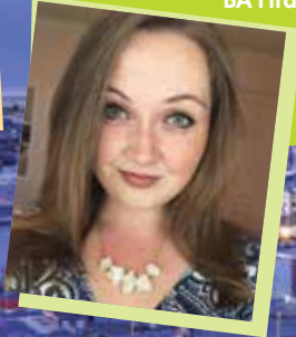
Becca BA Ffrangeg a Sbaeneg

"Roedd fy mlwyddyn gyntaf fel myfyrwraig ym Mhrifysgol Abertawe yn un bythgofiadwy. Mae wedi fy ngalluogi i wneud ffrindiau newydd ac atgofion di-ri, dysgu'n fanylach am amrywiaeth o bynciau mae gennyf ddiddordeb ynddynt, ac wedi darparu cyfleoedd diddiwedd. Ers dod i'r Brifysgol dwi wedi datblygu fel unigolyn, wrth gyfarwyddo â'r annibyniaeth sydd ynghlwm â bywyd myfyrwyr. Gan fy mod yn astudio leithoedd Modern, byddaf yn gwario fy nhrydedd blwyddyn dramor ac dwi'n awyddus i wneud y mwyaf o'r cyfle hwn gan ddysgu mwy am ieithoedd a diwylliannau'r gwledydd rwyf yn astudio amdanynt."