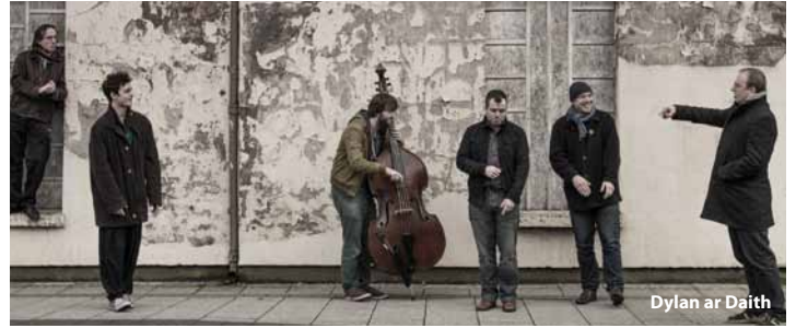
Dylan ar Daith

nid yn unig o ran ei eiriau ond yn ei ffordd o gyflwyno barddoniaeth, gyda rhythm a goslef y llais."