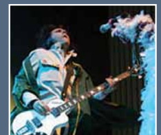
Llyfrgell yn helpu'r Manics