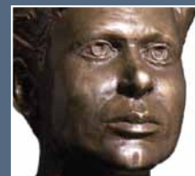
Hip-hop a jazz i Dylan