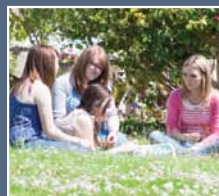
Y brifysgol orau, medd myfyrwr

"Cam mawr at fod yn un o 30 prifysgol orau gwledydd Prydain."